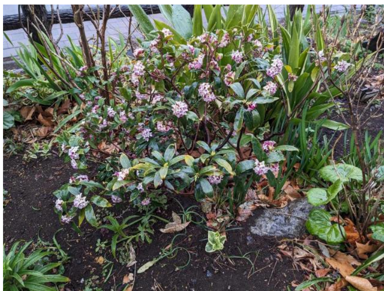
福岡中央公園 沈丁花 2024年3月